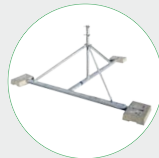
Modèle sur demande